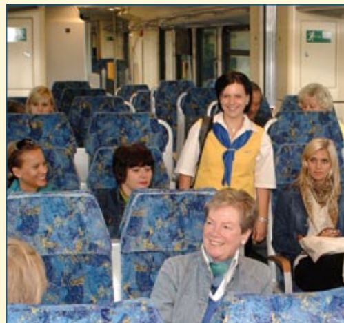
Freundlicher Service für die Fahrgäste der eurobahn.