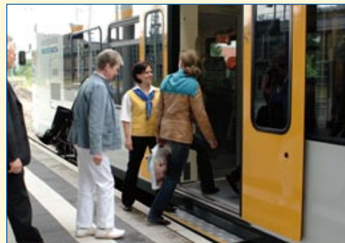
Auf dem Hellweg-Netz fahren seit 14.12.2008 25 neue Triebwagen des Typs „FLIRT“.

Im Dezember 2008 hat die eurobahn das Hellweg-Netz übernommen – ein großes Regionalbahn-Netz um Hamm und Dortmund.